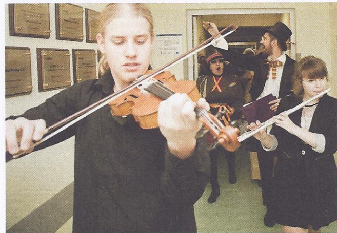
Uczestnicy „Narodowego Czytania Fredry” w szpitalu