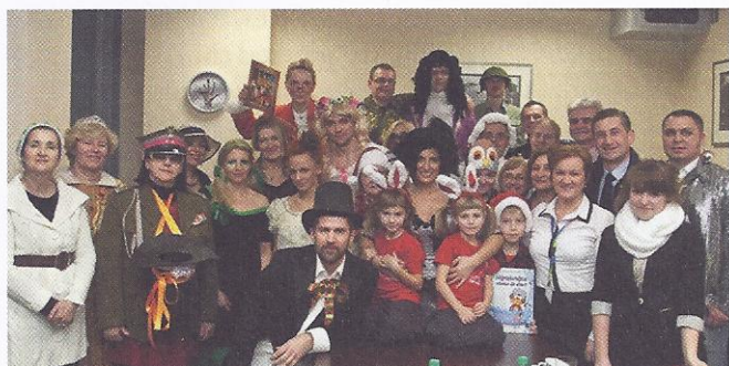
Zespół „Narodowego Czytania Fredry” w szpitalu

szzonego do realizacji przez Starostwo Powiatowe w Puławach w ramach akcji Prezydenta Bronisława Komorowskiego i Kancelarii Prezydenta RP.